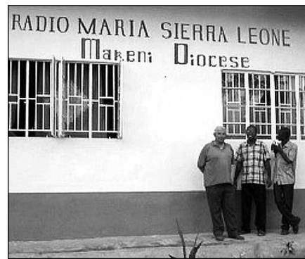
Voluntarios y empleados de la Radio.