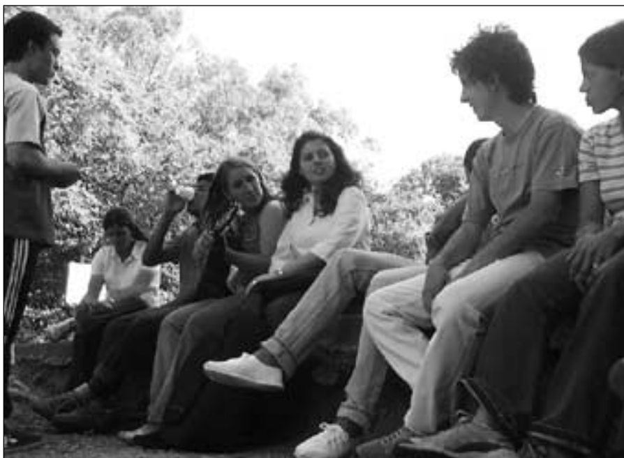
Los chicos preparan su participación para el fogón que se realizó al cierre del retiro.

Para sumarte escribí a: oleadajoven@radiomaria.org.ar