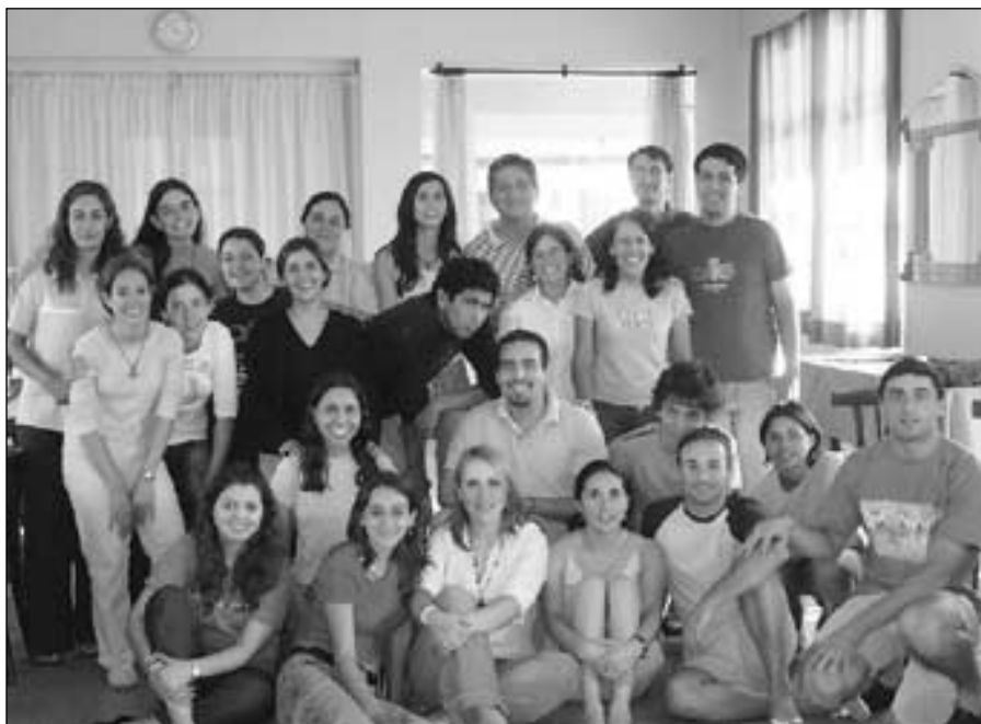
Los jóvenes de la Oleada disfrutaron del primer encuentro en La Falda.